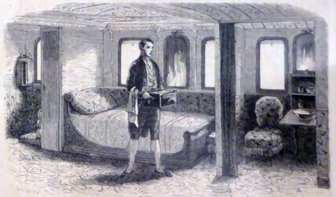
LA CHAMBRE À COUCHER.