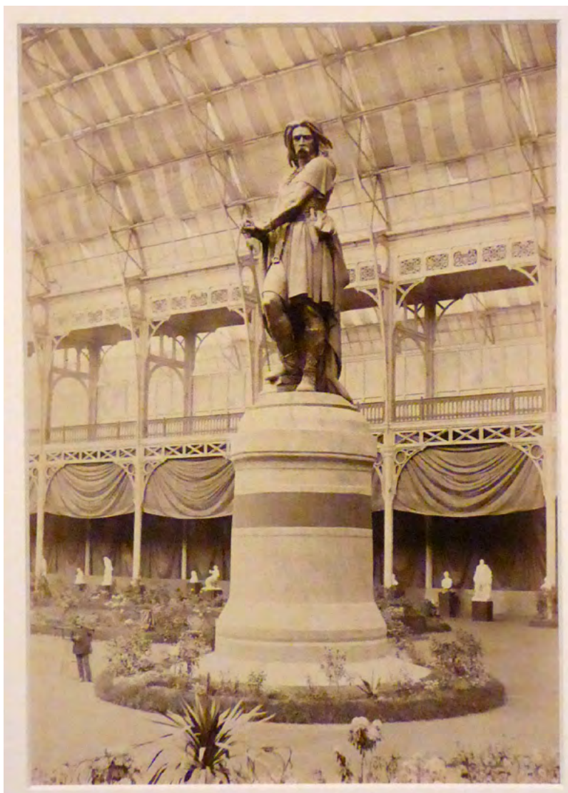
Photographie du Salon de 1865: «Vercingétorix», statue en pied, cuivre par Aimé Millet Photograph of the Salon of 1865: "Vercingetorix", standing statue, copper by Aimé Millet 1865 Photographie ; tirage sur papier albuminé • Photograph, printed on albumin paper