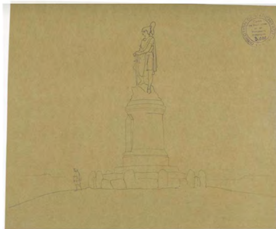
Dessin préparatoire pour le monument à Vercingétorix prévu à Alise-Sainte-Reine (Côte-d'Or) Preparatory drawing for the monument to Vercingetorix planned for Alise-Sainte-Reine (Côte-d'Or) Eugène Viollet-le-Duc 1865 Dessin; encre sur calque contrecollé • Drawing, ink on mounted tracery paper Charenton-le-Pont, Médiathèque de l'architecture et du patrimoine, 1996/083 - 3000 Napoléon III ordonne plusieurs campagnes de fouilles archéologiques pour retrouver les sites de la Guerre des Gaules de Jules César. Financée par l'Empereur, cette statue est érigée en août 1865 à l'emplacement de l'oppidum d'Alésia sur un piédestal de pierre et de granit. Viollet-le-Duc en donne le dessin et le sculpteur Aimé Millet exécute l'œuvre en tôle de cuivre sur une charpente métallique. Le héros gaulois est représenté sous les traits de Napoléon III et avec un équipement historiquement anachronique. Napoléon III ordered several campaigns of archaeological excavations to identify the sites of Julius Caesar's Gallic Wars. This statue, financed by the Emperor, was erected in August 1865 at the site of the oppidum of Alésia, on a pedestal of stone and granite. Viollet-le-Duc provided a drawing, and the sculptor Aimé Millet executed it in copper panels over a metal frame. The Gallic hero is represented with the features of Napoléon III and with historically anachronistic equipment.