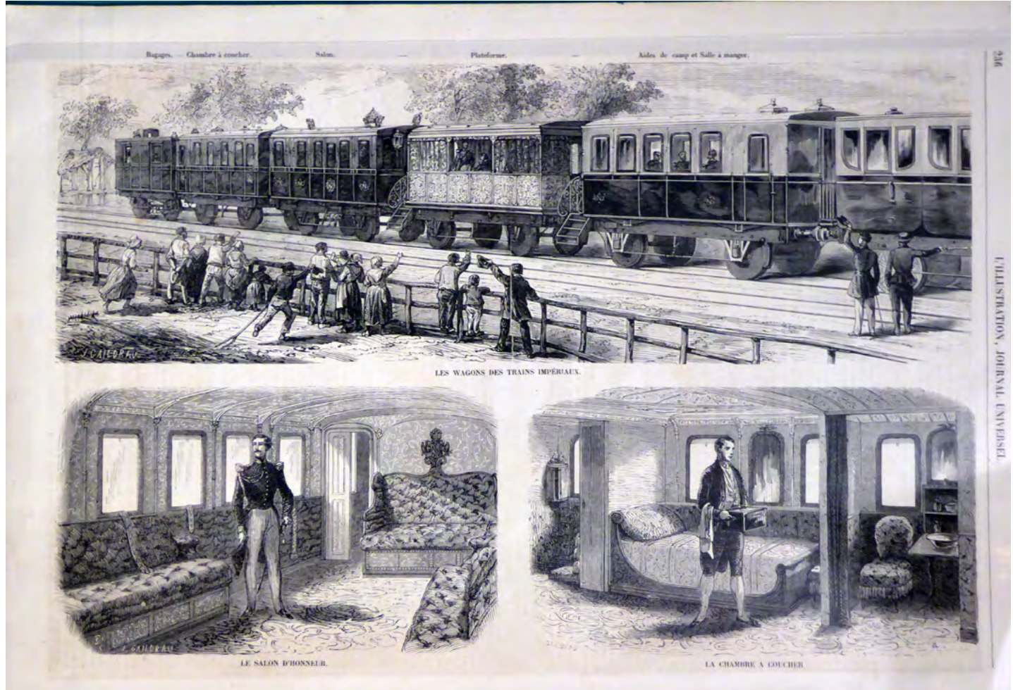
Bagages. — Chambre à coucher. — Salon. — Plate-forme. — Aides de camp et Salle à manger.

Paris, musée d'Orsay, RF 3989 2; Don de la famille de Viollet-le-Duc au musée de Sculpture comparée, 1882