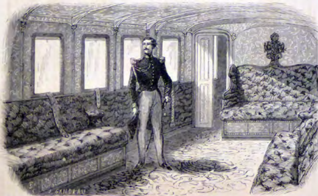
LE SALON D'HOMME.