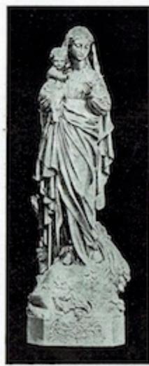
Hauteur : 170 cm 170 cm - 170 cm 170 cm - 170 cm 170 cm - 170 cm