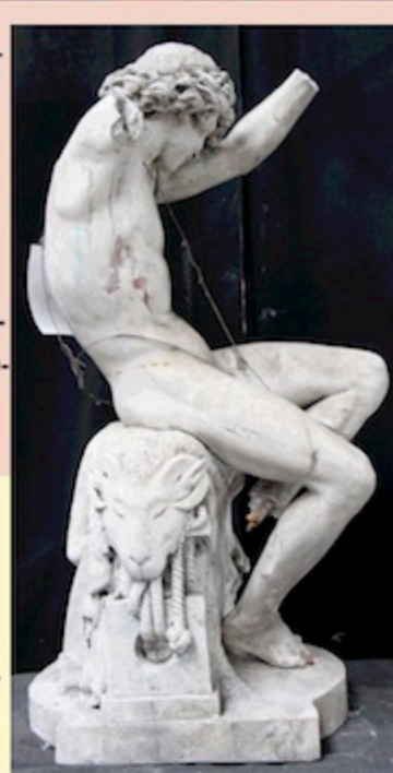
Jeune Braconnier - sculpteur : Charles Gauthier.

Des modèles réalisés d'après des œuvres antiques, médiévales ou modernes sont également édités d'après Léonard de Vinci, Michel-Ange, Raphaël, Germain Pilon ou encore Jean Goujon.