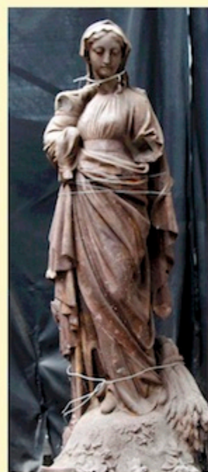
NOTRE-DAME DES CHAMPS L. LAMBERT

La seconde thématique couvre pour le tiers restant des modèles à caractère profane, parmi lesquels des monuments d'illustres, une grande galerie de bustes de notables (parfois inconnus), d'œuvres ou d'allégories romantiques, teintées d'exotisme ou encore politiques. Quelques éditions en fonte ou en bronze sont également présentées.