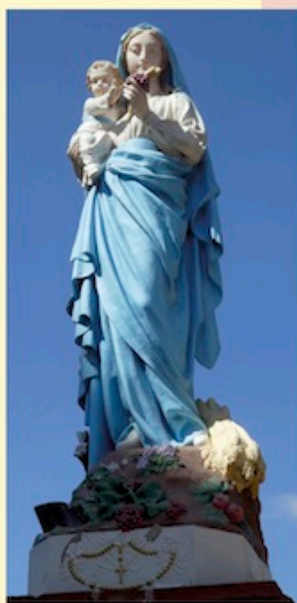
Trois états d'une sculpture : contre-modèle (Paradis de Dommartin-le-Franc), le catalogue de vente - détail - (1928) avec les différentes tailles proposées et la statue sur la place de Mondonville (Haute-Garonne).