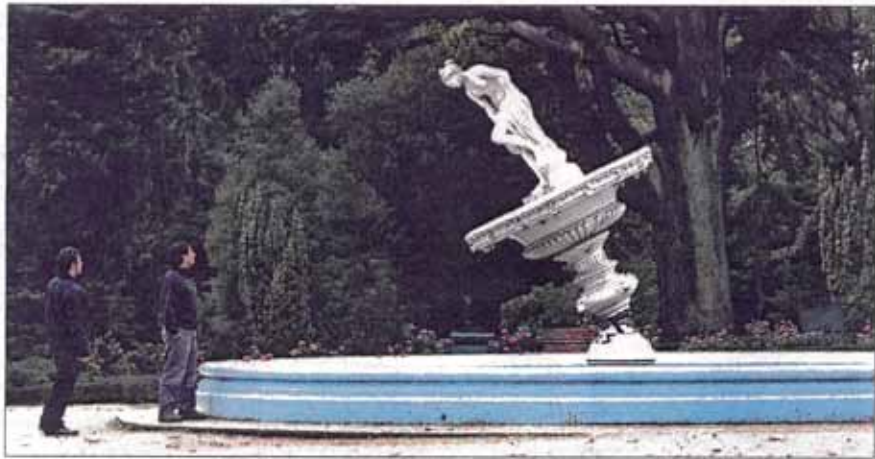
60% de las estatuas de hierro cayó bajo la fuerza del terremoto grado 8.8 del sábado pasado.

El tercer monumento nacional de esta ciudad —la hidroeléctrica Chivilingo—, ubicada 13 kilómetros al sur de Lota, está a la espera de ser visitada por técnicos para ver los daños que sufrió. ■