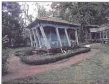
Uno de los primeros observatorios meteorológicos del país sufrió daños estructurales.