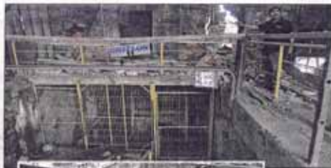
La histórica mina de carbón también sufrió daños en su taller de soldadura.