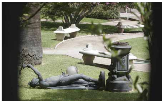
Derrumbadas estaban las estatuas del edificio del ex Congreso Nacional. El inmueble de estilo neoclásico comenzó a construirse en 1857. Se inauguró en la manzana comprendida entre las calles Compañía y Bandera, destacándose no sólo por la belleza de su arquitectura, sino que también por sus jardines.

http://emol.tv/emol.com/actualidad/indexSub.asp?id_émoi=4327