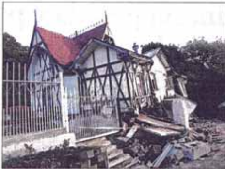
La entrada y el edificio de recepción del parque quedaron completamente destruidos.