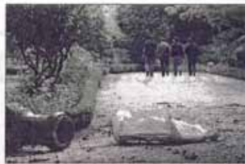
El parque sufrió deslizamientos de tierra, que afectaron su ornamentación.